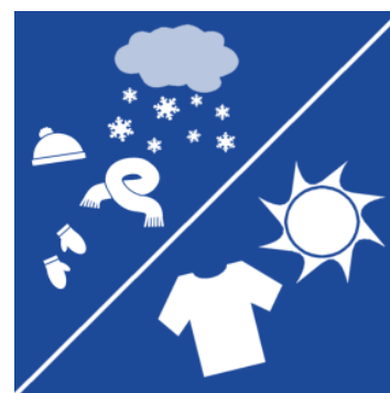
Udetøj efter årstiden