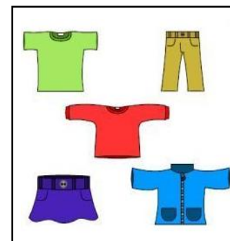
Skiftetøj som barnet passer